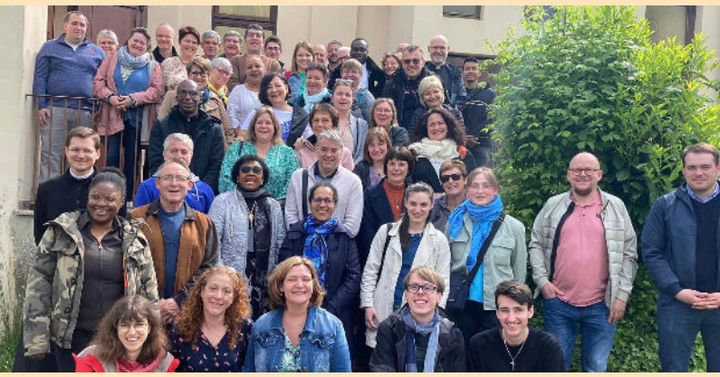
Formation des accompagnateurs Pelé Jeunes à Selestat

Saint-Urbain Bible en main : dimanche 19 mai à 9h10 sacristie Saint-Urbain.