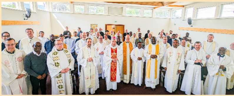
Rencontre des prêtres de la zone de Strasbourg avec Mgr Delannoy